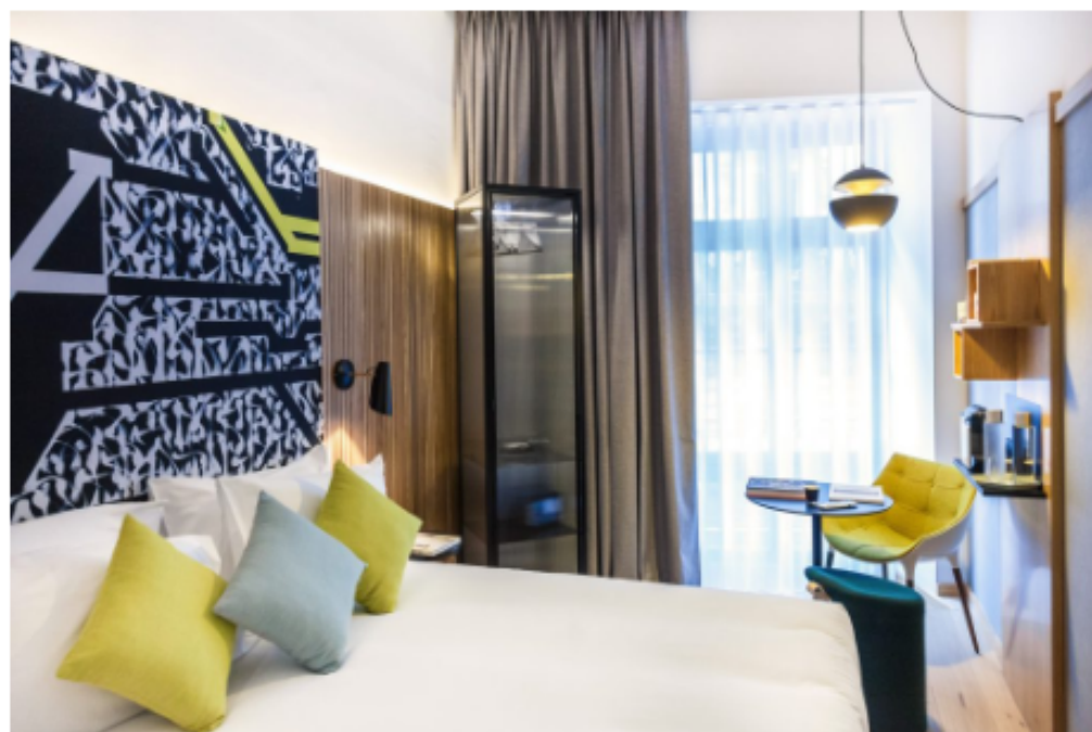
Au premier étage, on retrouve dans chaque chambre l'œuvre de Lek et Sowat sous forme de têtes de lit.

La restauration du bâtiment a nécessité 2 ans et demi de travaux. Le principe du Drawing Hotel Paris est de proposer un centre d'art (le Drawing Lab Paris) où quatre artistes seront mis à l'honneur tour à tour de février 2017 à mai 2018. Le D. bar au rez-de-chaussée est un lieu de détente où chacun peut venir se poser sans forcément être client de l'hôtel. Thé et mixologie se côtoient grâce à l'inventivité du bartender Kévin Igot. L'hôtel est composé de 48 chambres (et 2 suites) aménagées comme de véritables espaces de vie. Toutes les pièces sont meublées avec des éditeurs comme Cassina ou DCW éditions pour les luminaires. Les architectes du projet sont Soferim et l'agence d'architecture Nido à qui l'on doit l'agencement des chambres mais aussi le choix des couleurs et des matières, le tout dans un respect du langage pur et minimal d'une galerie et des contraintes liées à l'hôtellerie. Toutes les chambres sont meublées de façon identique. Seule la tête de lit vient rappeler l'artiste mis à l'honneur à l'étage. Et cerise sur le gâteau, le Drawing Hotel Paris possède un patio très lumineux et coloré, attenant au D. bar, et un rooftop au dernier étage invitant les clients à des moments de détente et de convivialité.